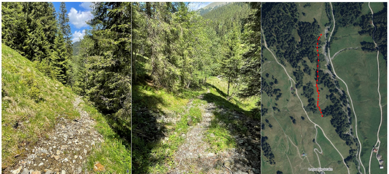
Abbildung 1: bestehender Viehtriebweg im unteren Teilabschnitt (links, mitte) und grober Lageplan (rechts).

Im agrarfachlichen Gutachten wird zudem argumentiert, dass die geplante Weganlage insbesondere auch der besseren Erreichbarkeit der Weideflächen zur veterinärmedizinischen Versorgung und Betreuung der Tiere, sowie der erleichterten Durchführung von Instandhaltungs- und Pflegemaßnahmen im Zuge der Almbewirtschaftung mit Hilfe von Kraftfahrzeugen dienen soll.