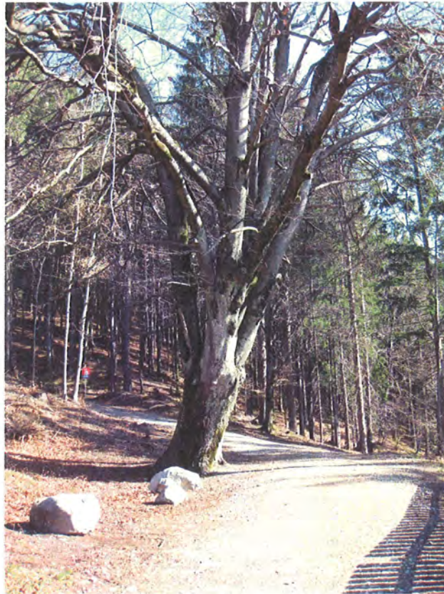
Abbildung 5: Beginn des geplanten Stichweges beim Naturdenkmal Blutbuche.