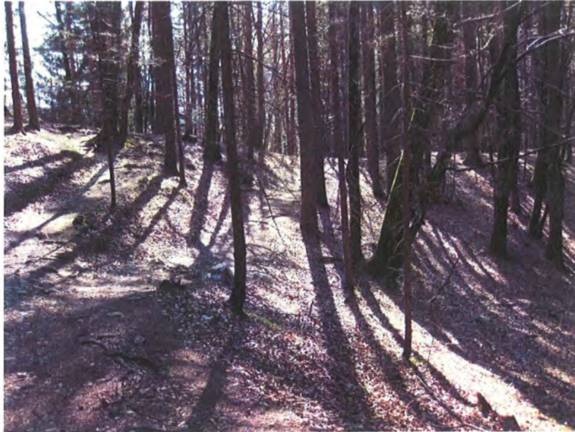
Abbildung 9: Weggabelung mit Rastplatz am Ende des projizierten Stichweges.