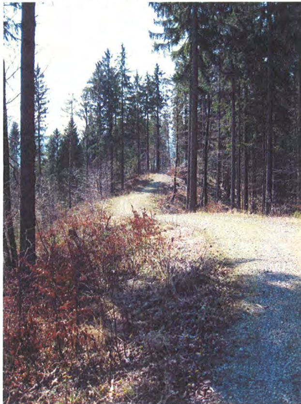
Abbildung 12: Talwärtiger Stichweg.