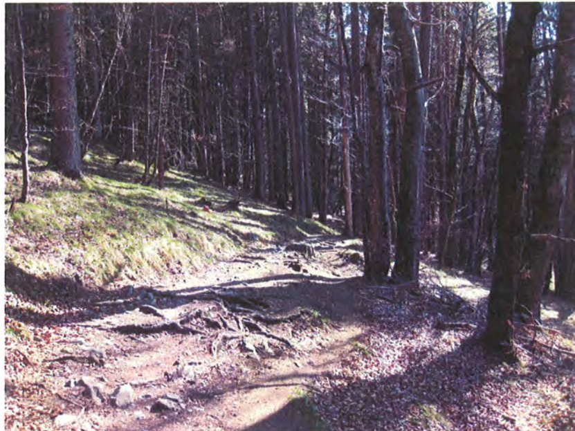
Abbildung 6: Typische Ausformung des Steiges mit variierenden Breiten und unebener Oberfläche, die von Wurzeln durchzogen wird.