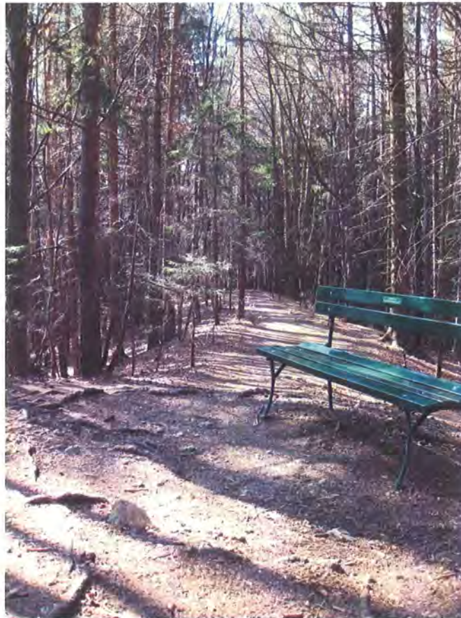
Abbildung 2: Rastplatz am Ende des geplanten Stichweges.

Am Ende des geplanten Forstweges soll ein Umkehrplatz (Manipulationsplatz) errichtet werden. Derzeit besteht in diesem Bereich ein Rastplatz mit Bank und Wegabzweigung Richtung Buzzihütte.