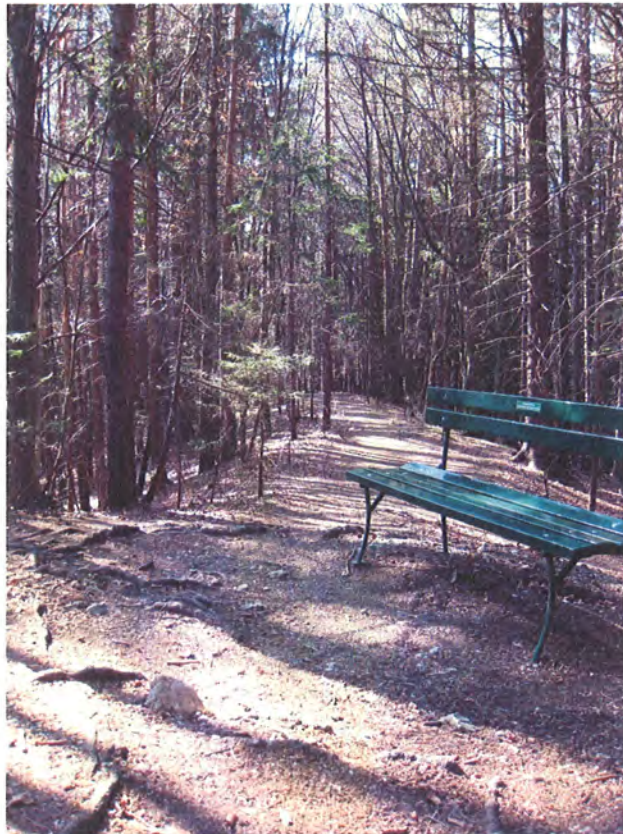
Abbildung 10: Direkter Abstieg zur Buzzihütte.