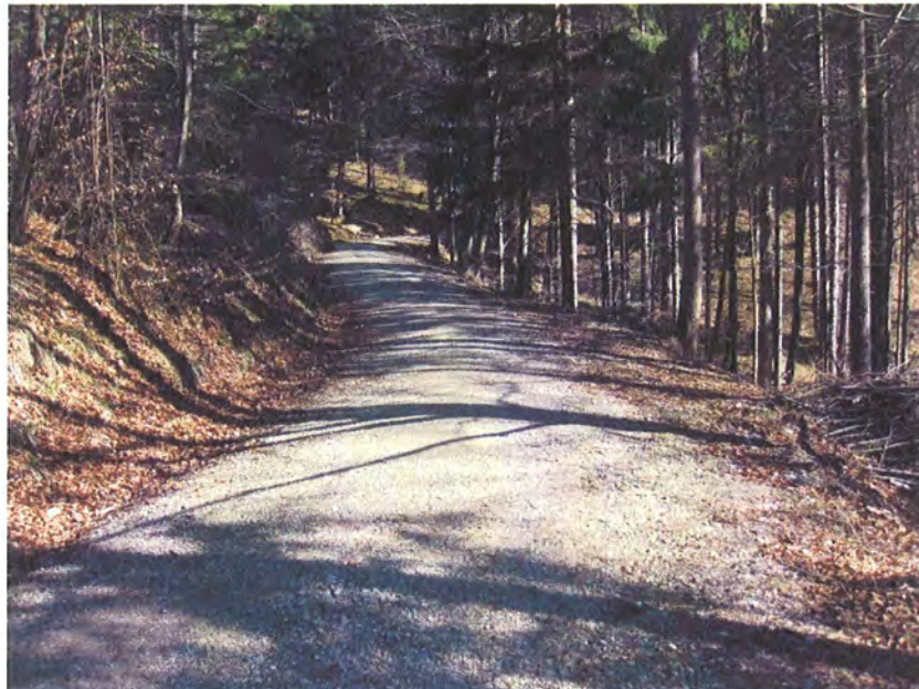
Abbildung 8: Bereits von einem Forstweg überformter Teil des Stangensteiges östlich des geplanten Vorhabens. Deutlich zu erkennen ist die Vereinheitlichung und Vergleichmäßigung im Gegensatz zum historischen Teil des Steiges.