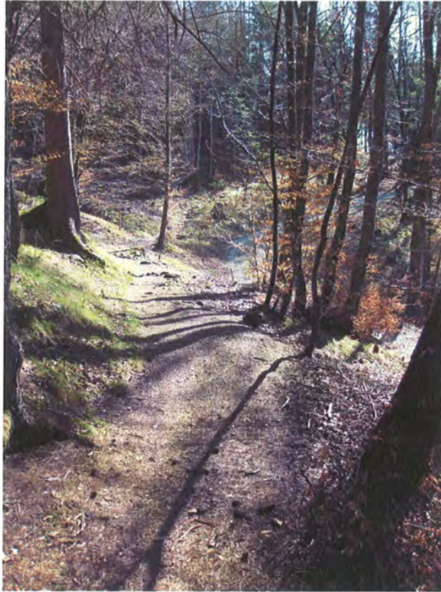
Abbildung 13: Licht und Schatten, Oberfläche und dem Gelände angepasster Wegverlauf lassen den Steig mit seiner Umgebung verschmelzen.