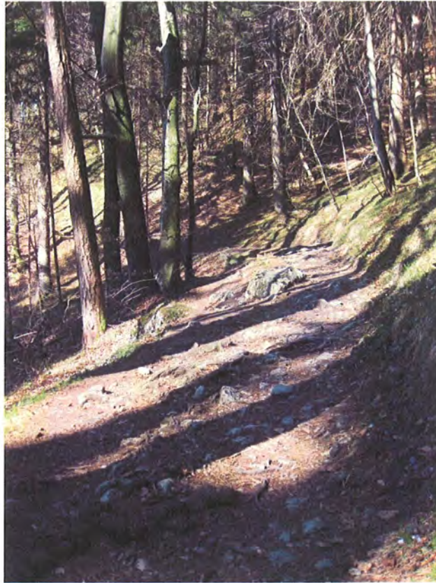
Abbildung 7: Wegteilstück im betroffenen Projektabschnitt.