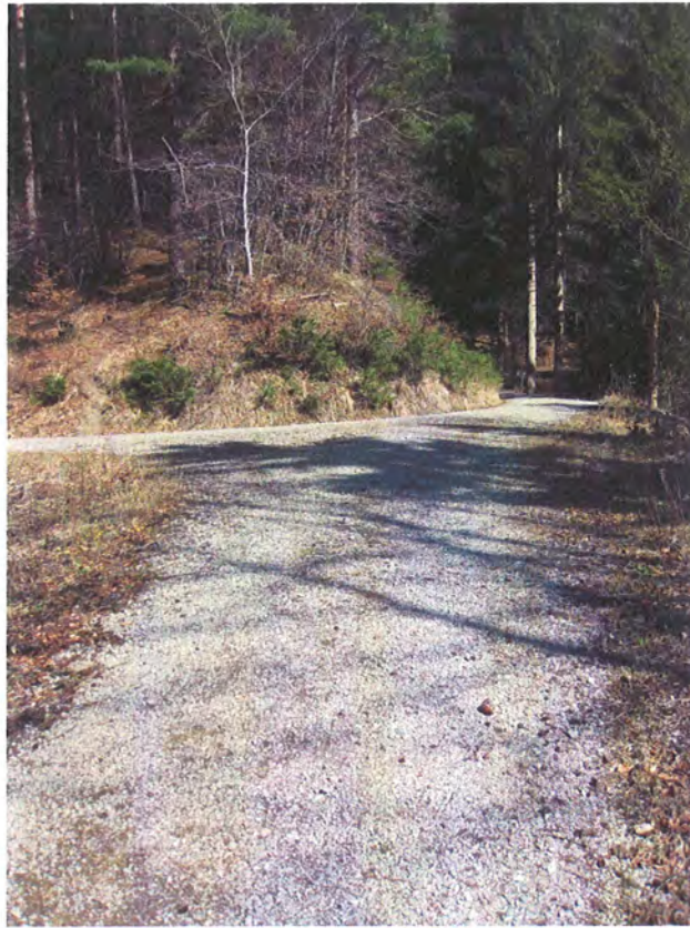
Abbildung 11: Dieselbe Situation wie auf den 2 vorhergehenden Bilder östlich des Projektgebietes in einem bereits von Forstwegen überformten Wegabschnitt.