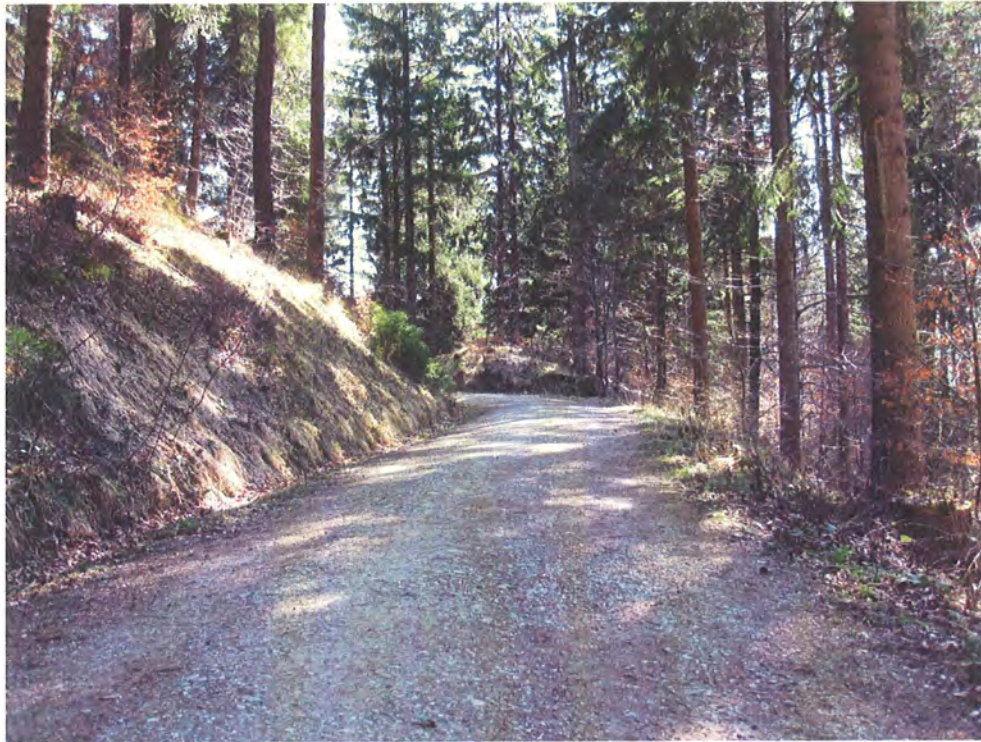
Abbildung 15: Typisches Landschaftsbild in Bereichen, in denen der Stangensteig bereits überformt ist und im Gegensatz dazu