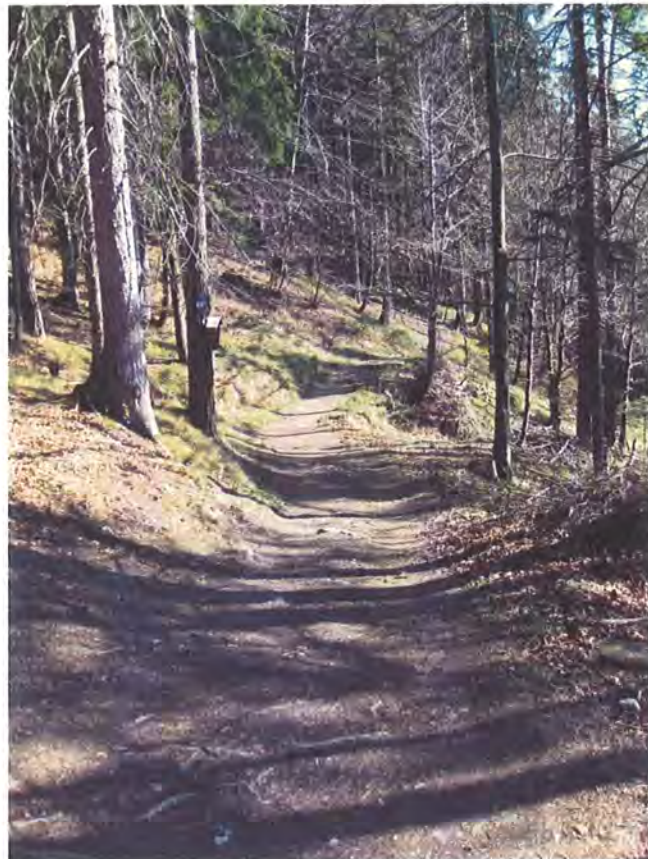
Abbildung 1: Der Stangensteig am Beginn des geplanten Forstweges.

Geplant ist die Errichtung des Forstweges „Hainzenmarterlweg“ mit einer Länge von 200 m und einer Fahrbahnbreite von 3,5 m. Der Weg soll beim Ende des Fuchseggweges beim Naturdenkmal Blutbuche (Naturdenkmal ND_101_31 seit 2001) beginnen und als Stichweg circa 200 m nach Osten im Bereich des bestehenden Stangensteiges führen.