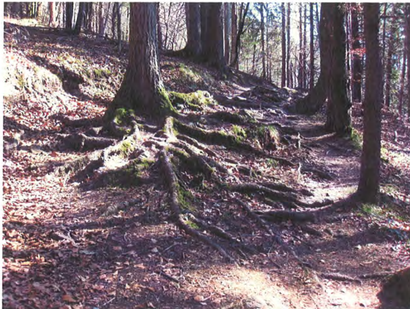
Abbildung 14: Gerade für Kinder stehen derartige Steige an oberster Stelle hinsichtlich Erholungswert – im Gegensatz zum „langweiligen“ Gehen auf Forstwegen bleibt es auf solchen Steigen stets spannend.