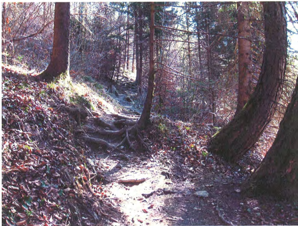
Abbildung 16: typisches Landschaftsbild in einem ursprünglichen Bereich des Stangensteigs.